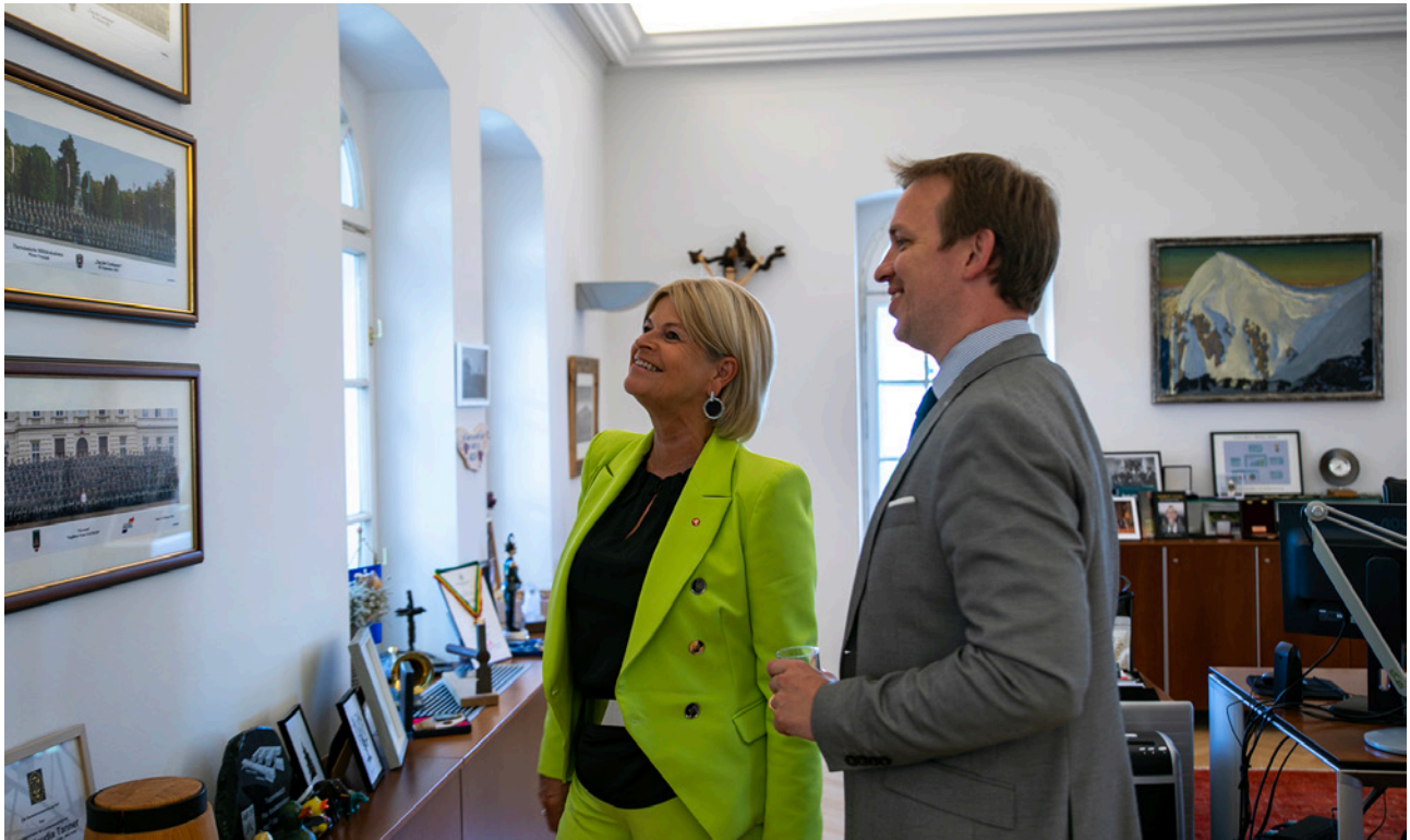
Tanners Büro ist mit Bildern vergangener MilAk-Absolventen dekoriert.