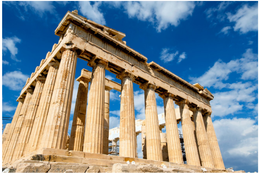
Griechenland gilt als die Wiege der Demokratie.

Was alle diese demokratischen Systeme durch die Geschichte hindurch eint, ist die Wahl. Die Wahl von Volksvertretern. Die Bürger haben die Möglichkeit, ihre (professionellen) Vertreter einzusetzen. Die, die ihnen am besten zu Gesicht stehen, die, die am meisten Meriten erworben haben, oder die, die ihnen am geeignetsten erscheinen. Organisiert ist dies in syndikalen Strukturen, den Parteien, wo sich