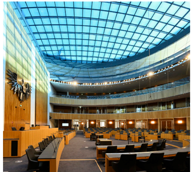
Die Demokratiewerkstatt hat ihre Heimat unter der opulenten Glaskuppel gefunden.