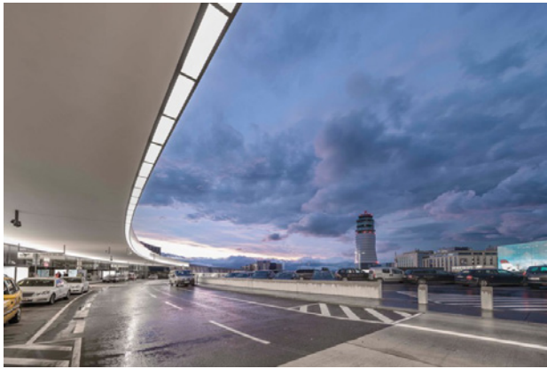
Der Flughafen Wien ist der größte heimische Airport.