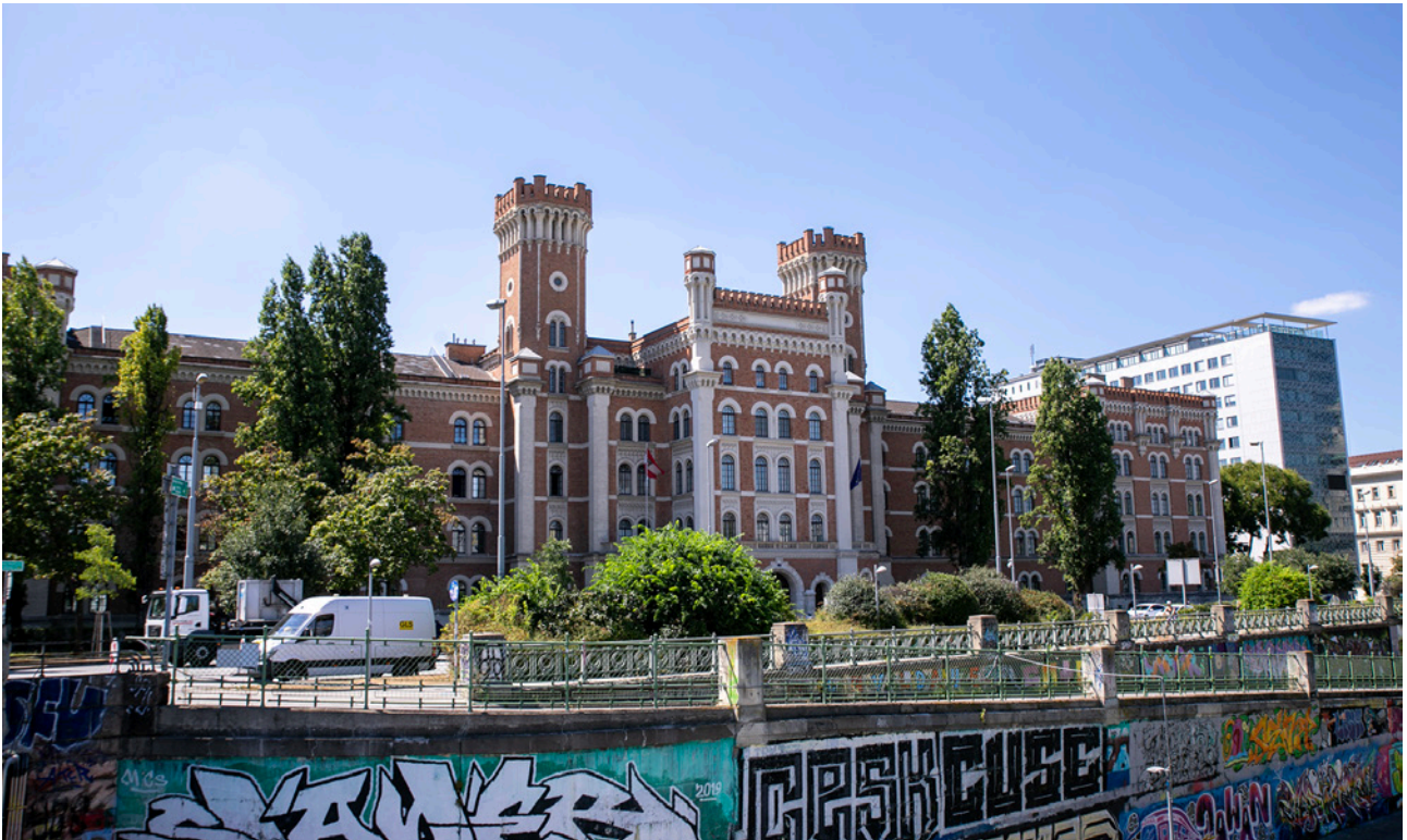
Das Verteidigungsministerium ist großteils in der Wiener Rossauerkaserne untergebracht.