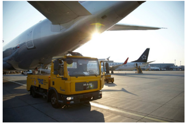
Über 250 Unternehmen sind am Flughafen Wien aktiv

Wenige, das ist heute nicht mehr der Fall. Aber wir stehen in einem harten globalen Wettbewerb. Unseren Wohlstand, unser hohes Sozialniveau und unsere Freiheit, wie auch die Kosten der ökologischen Transformation, können wir nur in und mit einem gemeinsamen europäischen Markt sichern.