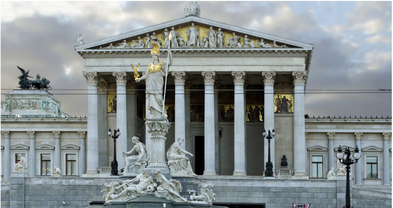
Alle Parteien rittern um Plätze im Haus am Ring

in der österreichischen Geschichte noch nie dagewesene Vielfalt an Parteien auf dem Stimmzettel zu finden sein: