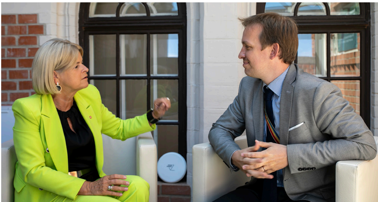
Verteidigungsministerin Tanner im Gespräch mit dem Couleur.

Seit Jänner 2020 ist Klaudia Tanner die erste Bundesministerin für Landesverteidigung in Österreich. Mit dem Couleur hat sie über die Bedeutung des österreichischen Bundesheers, geopolitische Entwicklungen, den Zivildienst und ihre eigenen Zukunft gesprochen.