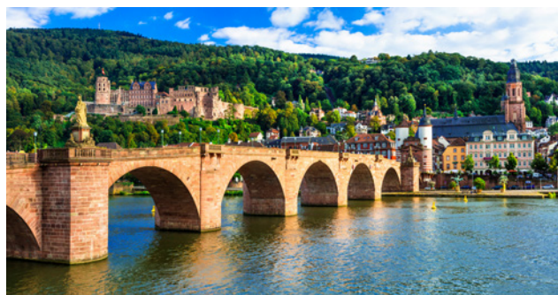
Heidelberg von der Karl Theodor Brücke